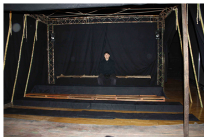
Côté public - gradin - intérieur de la structure