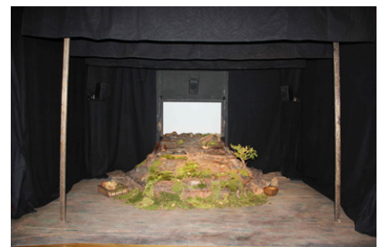
Côté scène - (intérieur de la structure)